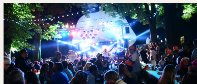
Bal des années 80