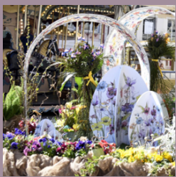
Marché de Pâques

Défilés de mode, braderie, marchés de saison, bal des années 80, etc... Chaque événement est pensé pour stimuler l'activité au cœur de notre ville. L'objectif est de donner du rythme et de maintenir la vitalité de notre centre-ville et soutenir nos commerçants dans une atmosphère festive et conviviale.