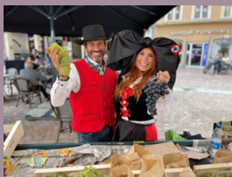
Marché des Vendanges

Défilés de mode, braderie, marchés de saison, bal des années 80, etc... Chaque événement est pensé pour stimuler l'activité au cœur de notre ville. L'objectif est de donner du rythme et de maintenir la vitalité de notre centre-ville et soutenir nos commerçants dans une atmosphère festive et conviviale.